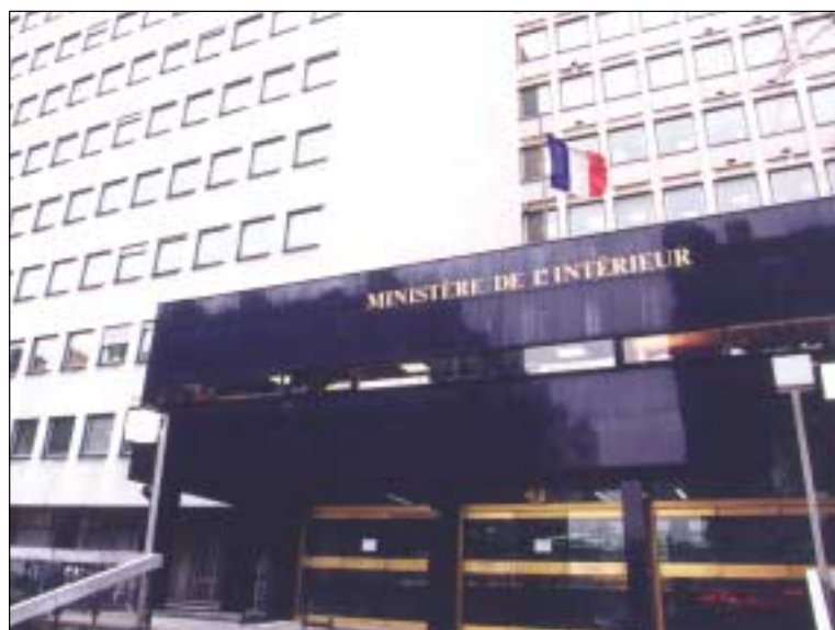
MINISTÈRE DE L'INTÉRIEUR

Elle doit également faire la preuve, après une analyse comparative des autres possibilités qui s'offrent à elle (un marché public ou une délégation de service public), que le contrat de partenariat s'avère clairement la formule la plus avantageuse, tant sur le plan administratif que juridique, financier et économique. En ce qui concerne l'Etat et ses établissements publics, un tel contrat ne peut être signé qu'après l'accord formel du ministre de l'Economie, des Finances et de l'Industrie chargé de vérifier la compatibilité du projet envisagé avec les objectifs de maîtrise des finances publiques de l'Etat. Le Ministre vérifie notamment que le surcoût lié au financement privé initial de l'équipement ou du service est compensé par des économies substantielles de gestion. Ces dispositions sont destinées à éviter que l'administration ne s'engage dans un contrat à long terme dont elle aura par la suite des difficultés à assumer la charge financière.